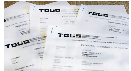
Festigkeitsprüfungen | Statisches Gutachten Zertifizierte Betonmischung