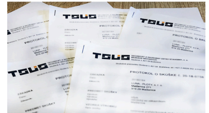
Festigkeitsprüfungen | Statisches Gutachten Zertifizierte Betonmischung