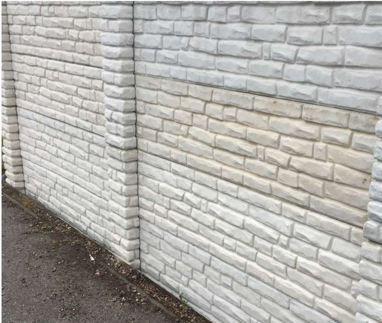
Abb. 4: Mögliche Farbabweichungen der Produkten durch verschiedene Produktionsdaten bzw. Reifbedingungen verursacht