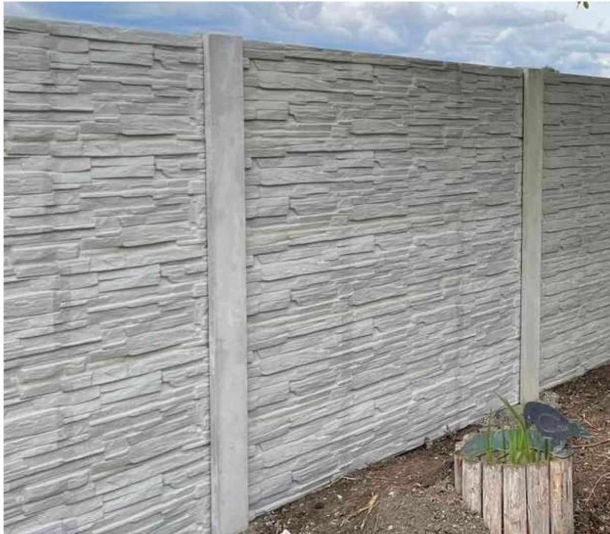
Abb. 3: Mögliche Farbabweichungen, die durch Plattenabtrennen beim Lagern / Transport entstehen können